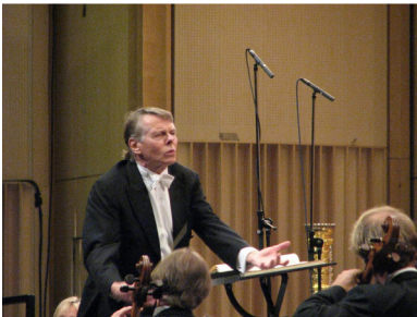
Mariss Jansons

Date fiind amintirile ultimei ediții a Festivalului George Enescu, sunt convins că prezența Royal Concertgebouw Orchestra din Amsterdam cu al său dirijor Mariss Jansons a fost așteptată frenetic. Dubla apariție a fost răsplătită pe de-a-ntregul, cu aprecieri la superlativ. Orchestra s-a confirmat ca mare ansamblu, Jansons ca mare șef. Privit, dirijorul emană – prin gestică-i amplă – o dăruire și o implicare profundă în expunerea texturii sonore, preocupat de întreg, de minuțioase subtilități la toate partidele, de dimensionări majestuoase, totul indus cu precizie milimetrică.