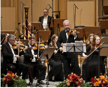
Dmitry Sitkovetsky

Despre prima lucrare interpretată, „Capriccio pentru vioară și orchestră” de Enescu în orchestrația lui Cornel Țăranu după schițele compozitorului, un opus plin de motive românești și orientale, dificil pentru solist, spun doar atât: ar fi păcat să nu se realizeze o înregistrare pe CD cu Dmitry Sitkovetsky, Royal Philharmonic Orchestra și Cristian Mandeal. Trei nume de lux.