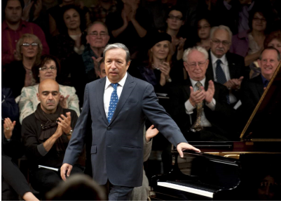
Murray Perahia

Imaginea lui Sviatoslav Richter mi-a apărut și ascultându-l pe Murray Perahia. „Sonata nr.23 în fa minor op.57, Appassionata” de Beethoven: forță telurică venită din acumulări și lupte interioare, magmă forjată în adâncimi de spirit, cascade sonore în impresionante vârtejuri, puteri nebănuite, gradații și contraste. Pentru puțină vreme, calmul și pacea s-au instaurat în partea secundă, „Andante con moto”, pentru ca finalul „Preso” să atingă dimensiuni fabuloase de turbulență expresivă.